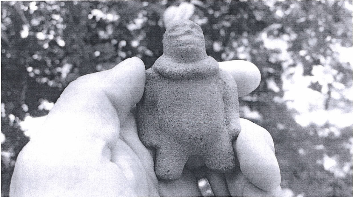
Figura 2. Figurilla cerámica Zoomorfa de la colección estudiada.