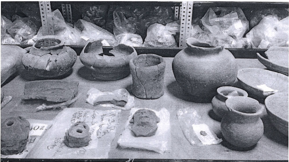
Figura 3. Distintos artefactos cerámicos de la colección de 157 piezas.